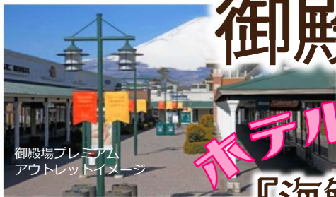
御殿場プレミアムアウトレットイメージ